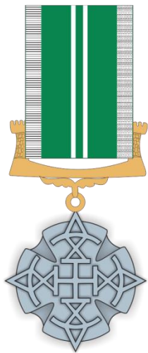
მედალი საქართველოს სასაზღვრო პოლიციაში უმწიკვლო სამსახურისთვის II ხარისხის