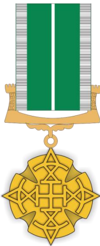
მედალი საქართველოს სასაზღვრო პოლიციაში უმწიკვლო სამსახურისთვის I ხარისხის