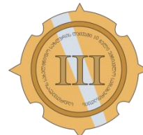
მედალი საქართველოს სასაზღვრო პოლიციაში უმწიკვლო სამსახურისათვის III ხარისხის