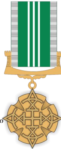
მედალი საქართველოს სასაზღვრო პოლიციაში უმწიკვლო სამსახურისთვის III ხარისხის